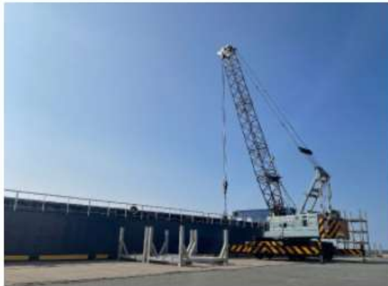
トラッククレーン