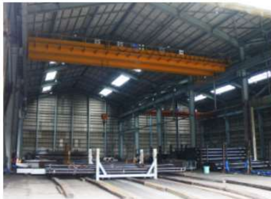
ホイスト式天井クレーン